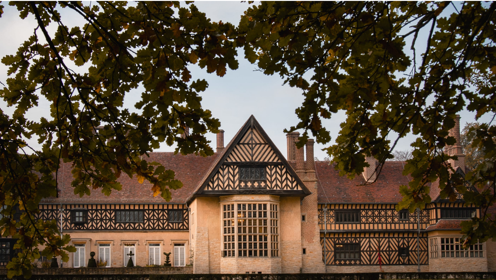
Schloss Cecilienhof im Neuen Garten